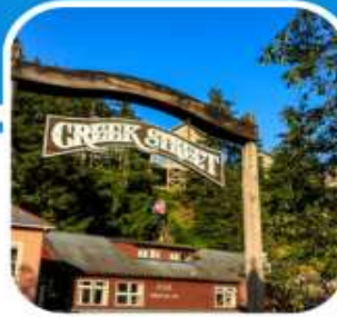
เมืองท่าหน้าเดิน เมือง Ketchikan