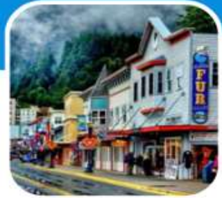
เมืองท่าเล็ก ๆ น่าเที่ยว เมือง Juneau

บินไปนอนก่อน 2 คืน ก่อนลงเรือ เที่ยวแวนคูเวอร์ รวมค่าวีซ่า ซอปิ้งจูงใจ บิน สายการบิน แอร์ไชน่า