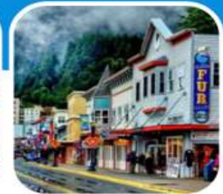
เมืองท่าเล็ก ๆ น่าเที่ยว เมือง Juneau

บินไปนอนก่อน 2 คืน ก่อนลงเรือ เที่ยวแวนคูเวอร์ รวมค่าวีซ่า ซอปิ้งจูงใจ บิน สายการบิน แอร์ไชน่า