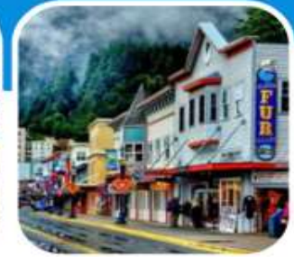
เมืองท่าเล็ก ๆ น่าเที่ยว เมือง Juneau

บินไปนอนก่อน 2 คืน ก่อนลงเรือ เที่ยวแวนคูเวอร์ รวมค่าวีซ่า ซอปิ้งจูงใจ บิน สายการบิน แอร์ไชน่า