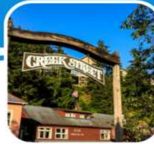
เมืองท่าหน้าเดิน เมือง Ketchikan