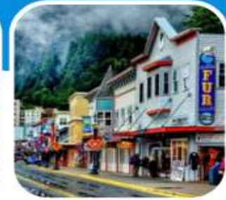
เมืองท่าเล็ก ๆ น่าเที่ยว เมือง Juneau

บินไปนอนก่อน 2 คืน ก่อนลงเรือ เที่ยวแวนคูเวอร์ รวมค่าวีซ่า ซอปปังจู่ใจ บิน สายการบิน แอร์ไชน่า