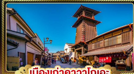
เมืองเก่าคาวาโกเอะ