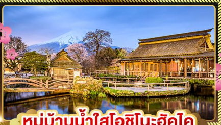
หมู่บ้านน้ำใสโอชิโนะฮัตสึ