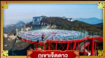
กุเขาเจ็ดดาว