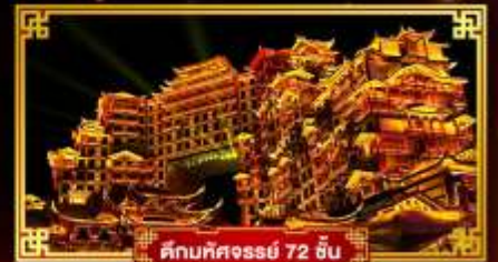
ต้นทศวรรษ 72 ชั้น