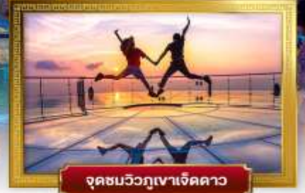
จตุรมบวิวกุเขาเจ็ดดาว