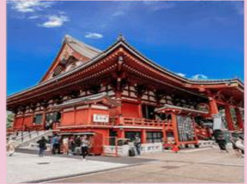
วัดอาซากุสะ SENSOJI TEMPEL | ASAKUSA TOKYO