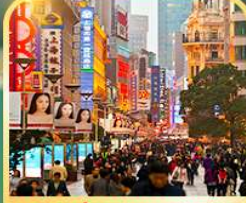
เดินเล่นถนนหนานจิง