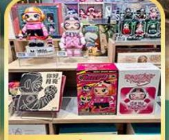
Popmart ห้างหุ่นยนต์ 77