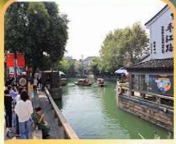
ท่องเที่ยวชมโบราณคดีเจียง