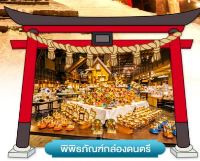
พิพิธภัณฑ์กล่องดนตรี

เดินทางโดยสายการบินแอร์เอเชียเอ็กซ์ อาหาร : 7 มื้อ โรงแรม : 3 ดาว