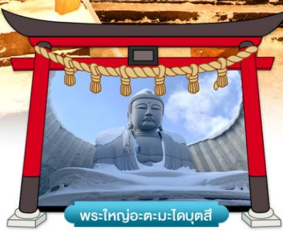
พระใหญ่อะตะมะไดบุตสึ