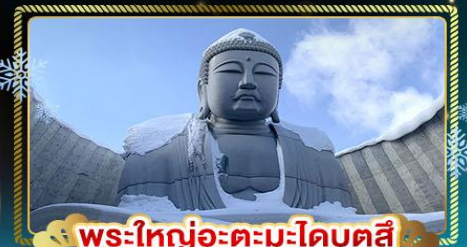
พระใหญ่อะตะมะโดบุตสึ