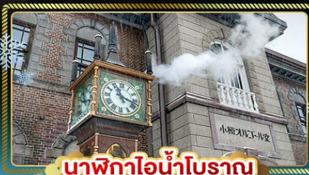
นาฬิกาไอน้ำโบราณ