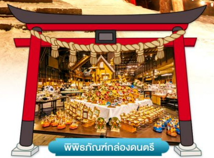
พิพิธภัณฑ์กล่องดนตรี