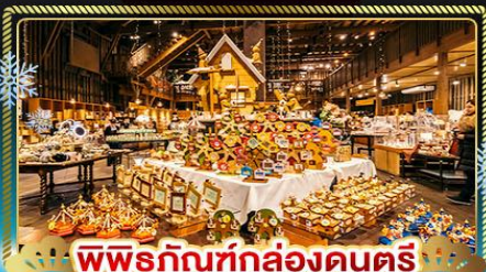
พิพิธภัณฑ์กล่องดนตรี