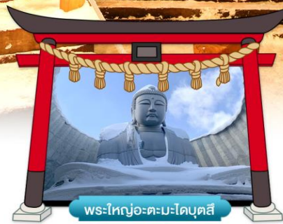
พระใหญ่อะตะมะไดบุตสึ