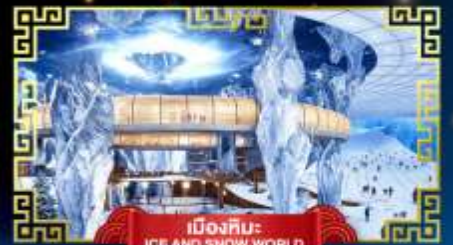
เมืองหิมะ: ICE AND SNOW WORLD