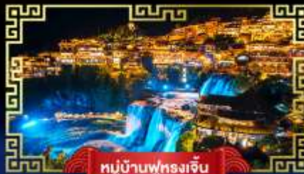
หมู่บ้านฟูหลงเจิ้น