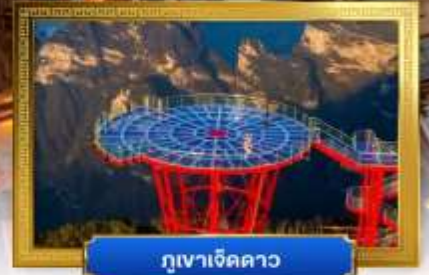
ภูเขาเจ็ดดาว