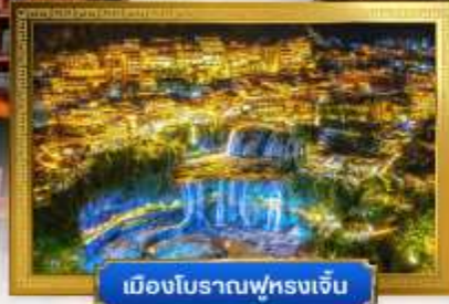
เมืองโบราณฟูหรงเจิ้น