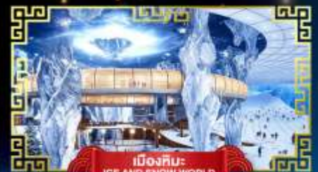
เมืองหิมะ: ICE AND SNOW WORLD