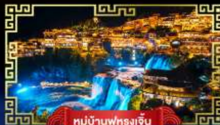
หมู่บ้านฟูหลงเจิ้น