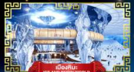
เมืองหิมะ ICE AND SNOW WORLD