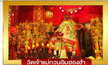
วัดเจ้าแม่กวนอิมฮองฮำ