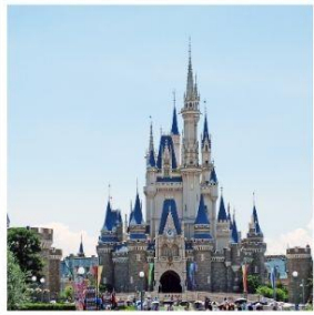
โตเกียว ดิสนีย์แลนด์ สวนฮานาโมโมะ โนะ ซาโตะ