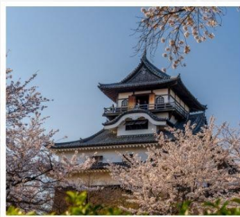
ปราสาทอินุยามะ