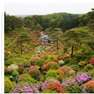
วัดชิโอะฟูเนะ คันนงจิ

โตเกียวดิสนีย์แลนด์ ดินแดนในฝันของคนทั้งโลก ฮานาโมโมะ โนะ ซาโตะ ดอกท้อกลางหุบเขาที่รอคุณมาเยือน ทางรถไฟสายเก่า เคอะเคะ อินโคลน์ 1 ในจุดชมซากุระที่สวยงามแห่งเกียวโต ขึ้นกระเช้าที่สูงที่สุดในญี่ปุ่น โคมากะทาเคะ กับแอ่งเทือกเขาสุดอัศจรรย์เช่นโจจิอิ เซอร์ค ปราสาทอินุยามะ 1 ใน 12 ปราสาทดั้งเดิมกับทิวทัศน์อันแสนสวยงาม ชิโอะฟูเนะ คันนงจิ วัดแห่งดอกไม้สด นกseen ที่ไม่ควรพลาด พักออนเซ็น 2 คิน!!! // อาหารพิเศษ...บุฟเฟ่ต์บึงย่าง, บุฟเฟ่ต์ชาบู, บุฟเฟ่ต์ชาบู กรุ๊ปสบายๆ เพียง 20 ท่านเท่านั้น!!!