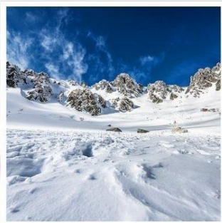
กระเช้าลอยฟ้าโคมากะทาเคะ