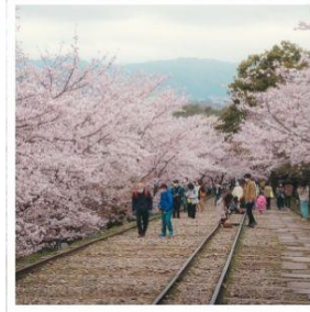
เคอะเคะ อินโคลน์