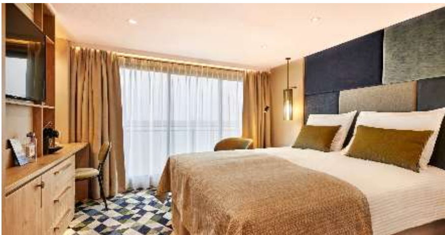
Double Cabin 17 m 2