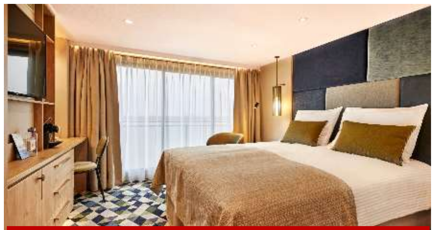
Double Cabin 17 m 2