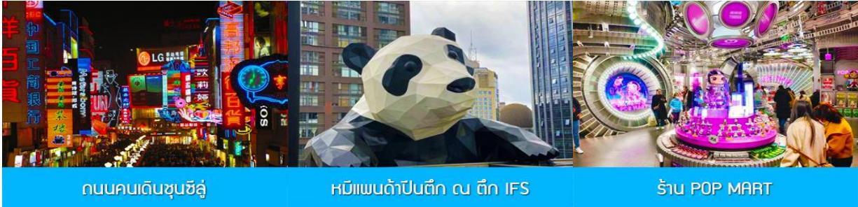
ถนนคนเดินซุนซีอู๋

พักที่ SEREMGETI หรือ โรงแรมระดับเดียวกัน โรงแรมระดับ 4 ดาว ห้องดีนหรือเทียบเท่า