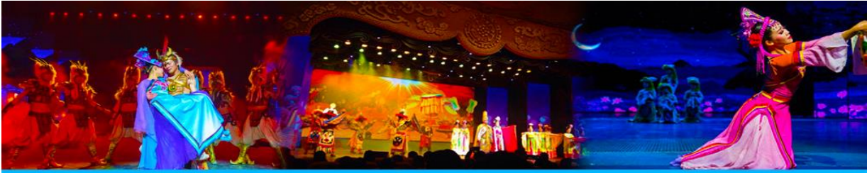
Romantic Show of Jiuzhai

หลังอาหารนำท่านสามารถเลือกซื้อรายการทัวร์เสริม พิเศษการแสดง ชุด Romantic Show of Jiuzhai เป็นการแสดงที่จัดขึ้นในโรงละครขนาดใหญ่ โดยการทุ่มทุนสร้างมหาศาล ทั้งเวที ฉากการแสดง ระบบ แสง สี เสียงที่ไฮเทค และทีมนักแสดงคัดสรรจากโรงเรียนนาฏศิลป์ เป็นการร้อยเรียงเรื่องราวของชนพื้นเมือง ประเพณีท้องถิ่น และเรื่องราว ตำนานในอดีต มาถ่ายทอดเป็นรูปแบบการแสดงที่อลังการละประทับใจ.....อัตราบัตรเข้าชม 400 หยวน หรือ 2,000 บาท/ท่าน หรือสอบถามรายละเอียดเพิ่มเติมได้ จากไกด์ท้องถิ่นหรือหัวหน้าทัวร์