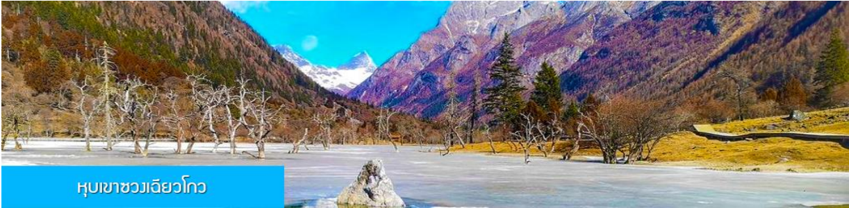
หุบเขาขวงเจียวโกว

นำท่านเที่ยวชม หุบเขาขวงเจียวโกว 双桥沟景区 ที่เป็นแหล่งท่องเที่ยวที่สวยงามที่สุดแห่งหนึ่งในเขตอุทยานกุสือครุณี นำท่านนั่งรถบัสของอุทยานที่วิ่งไปผ่านเส้นทางที่สร้างคู่ขนานกับลำธารภายในหุบเขา ท่านจะได้สัมผัสกับความสวยงามของทัศนียภาพธรรมชาติที่หาชมได้ยาก โดยมีภูเขาหิมะสูงตระหง่านอยู่เบื้องหลัง ธารน้ำใสไหลริน และสระน้ำที่มีสีเขียวมรกต ในฤดูใบไม้ผลิและฤดูร้อนท่านจะได้เห็นฝูงจามรีท่ามกลางทุ่งหญ้าเขียวขจี ส่วนในฤดูหนาวทุ่งหญ้าและพื้นดินจะปกคลุมด้วยพรมหิมะสีขาว.. รถบัสของอุทยาน จะนำนักท่องเที่ยวไปยังจุดชมวิวสำคัญต่าง ๆ ภายในเขตอุทยาน เพื่อให้นักท่องเที่ยวได้เที่ยวชมสถานที่และถ่ายรูปตามอัธยาศัย จนครบแ่เวลา นำคณะขึ้นรถเมล์ออกจากอุทยาน (จุดเที่ยวชมควาสงเหนือระดับน้ำทะเล 3,800 เมตร)