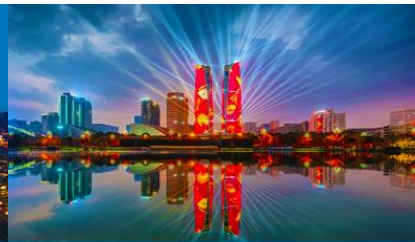
แสงสีมิตี ณ ตึกแฝด