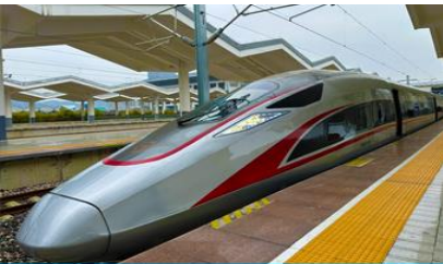
บึงรถไฟความเร็วสูง

พักที่ JIUYUAN HOTEL ระดับ 4 ดาวท้องถิ่นหรือเทียบเท่าในอุทยานจิวจ้ายโกว