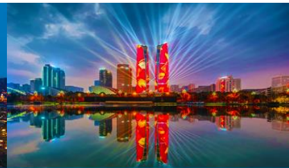
แสงสีมิตี ณ ตึกแฝด