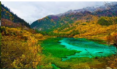
ทะเลสาบบอกยูง (PEACOCK LAKE)