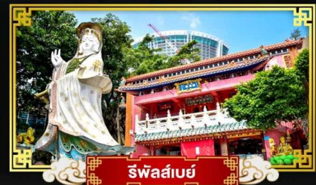
รีพัลส์เบย์