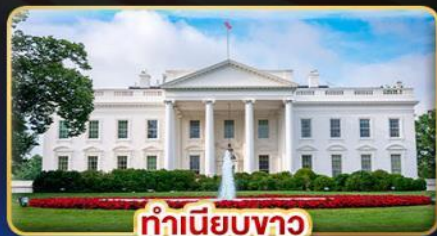
ทำเนียบขาว