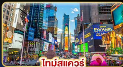
ไทม์สแควร์