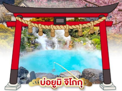
บ่อน้ำร้อน จิโกกุ