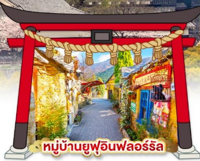
หมู่บ้านยูฟุอินฟลอริล