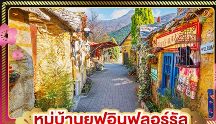
หมู่บ้านยุฟุอินฟลอรัล