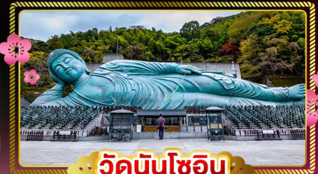
วัดนินโซอิน

สักการะวัดพระนอน นินโซอิน • เซ็คอินเมือง คามาโมโต้ • ปราสาทคามาโมโต้