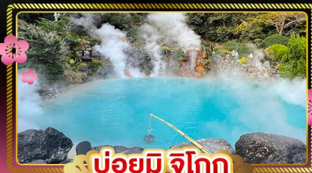
บ่อยูมิ จิโกกุ