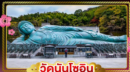
วัดนินโซอิน