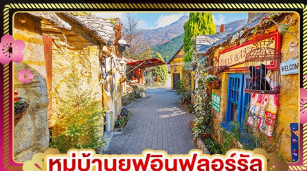
หมู่บ้านยูฟูอินฟลอร์ริส