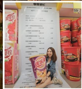
SNACK BUSY STATION