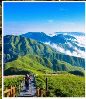
เขาอู่กงซาน