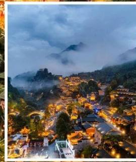
หุบเขาเทวดาวังเซียนกู่