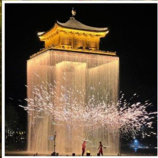
อู๋นวิโจว