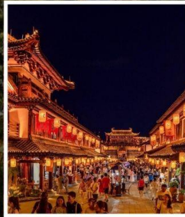
ถนนคนเดินว่านโซ่วกง