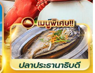
เมนูพิเศษ!! ปลาประจานริบตี