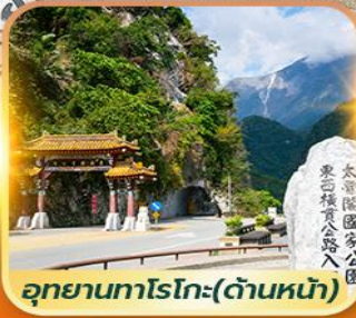
อุทยานทงโรโกะ(ด้านหน้า)