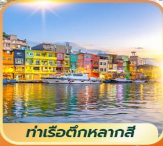
ท่าเรือตึกหลากสี