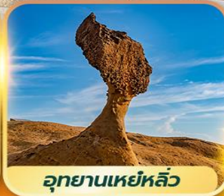
อุทยานเหยหลิว