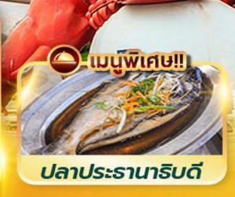
ปลาประจานาธิบดี