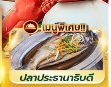
เมนูพิเศษ!! ปลาประจานาธิบดี