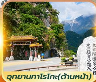
อุทยานทงโรโกะ(ด้านหน้า)