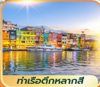
ท่าเรือตึกหลากสี