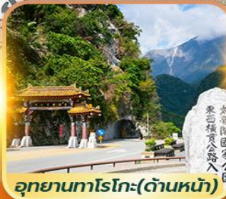
อุทยานทาจโกะ(ด้านหน้า)