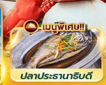
เมนูพิเศษ!! ปลาประจานริบตี