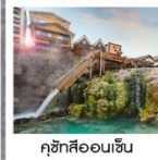
คุชิคิออนเซ็น