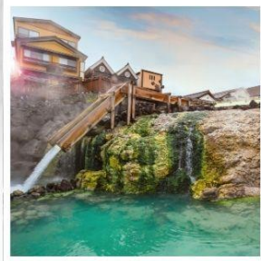
เมืองคุซัทสึ ออนเซ็น