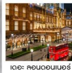
เดอะ คอนดอนเนอร์