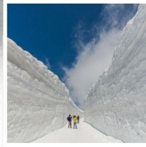
ค้ำแพงหิมะ เจแปนแอลป์