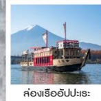
ล่องเรืออัมปะระ