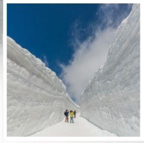
ค้ำแพงหิมะ เจแปนแอลป์