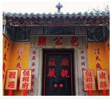
วัดฟาหลง