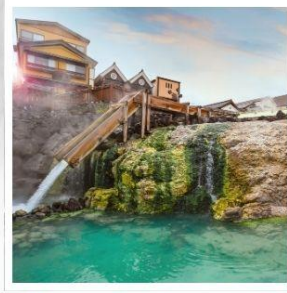
เมืองคุซัทสึ ออนเซ็น