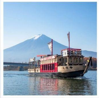
ล่องเรือฮุปปะระ