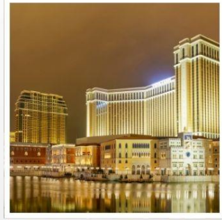
เดอะเวเนเซียน

ห้ามพลาดกับเมืองออนเซ็นแสนทรงเสน่ห์ คุซัทสึ สักการะ พระใหญ่ไดบุทสึ แห่งเมืองคามาคูระ สัมผัสประสบการณ์สุดพิเศษบนเทือกเขา เจแปนแอลป์ ปรับเปลี่ยนอริยาบท ล่องเรือฮุปุ่นโบราณ ชมฟูจิอย่างเพลิดเพลิน กราบไหว้ขอพรกับ เทพเจ้าองค์ไท่ส่วยเจี๋ย วัดฟาหลง สัมผัสความอลังการของ เดอะเวเนเซียน รีสอร์ทระดับเวิลด์คลาส ชมแสงสี เมืองลาสเวกัสแห่งซีกโลกตะวันออก "มาเก๊า" พักออนเซ็น 2 คืน!!! // อาหาร : บุฟเฟ่ต์ซาบู, บุฟเฟ่ต์ปิ้งย่าง กรุ๊ปสบายๆ เพียง 25 ท่านเท่านั้น!!!