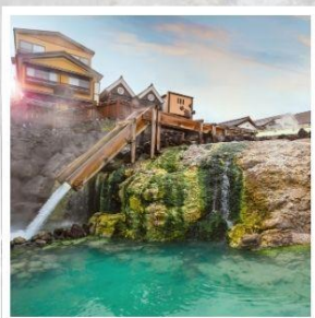
เมืองคุซัทสึ ออนเซ็น