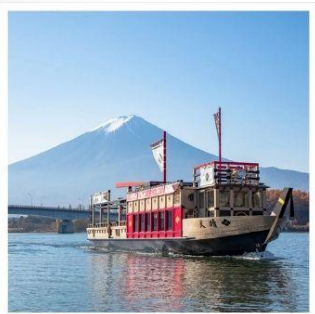
ล่องเรือฮุปปะระ