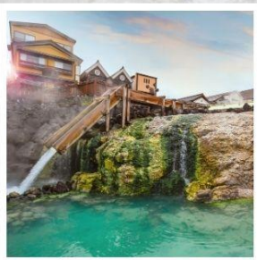
เมืองคุซัทสึ ออนเซ็น