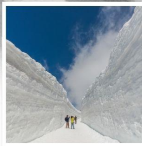
ค้ำแพงหิมะ เจแปนแอลป์