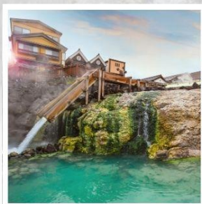
เมืองคุซัทสึ ออนเซ็น