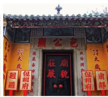
วัดฟาหลง