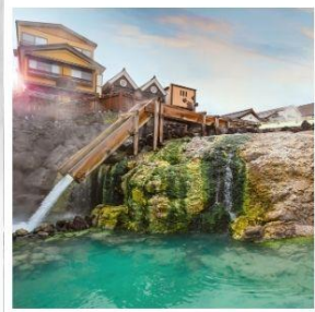
เมืองคุซัทสึ ออนเซ็น