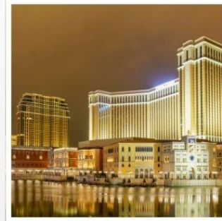
เดอะเวเนเซียน

ห้ามพลาดกับเมืองออนเซ็นแสนทรงเสน่ห์ คุซัทสึ สักการะพระใหญ่ไดบุทสึ แห่งเมืองคามาคูระ สัมผัสประสบการณ์สุดพิเศษบนเทือกเขาเจแปนแอลป์ ปรับเปลี่ยนอริยาบท ล่องเรือญี่ปุ่นโบราณ ชมฟูจิอย่างเพลิดเพลิน กราบไหว้ขอพรกับเทพเจ้าองค์ไต่สวยเจีย วัดฟากง สัมผัสความอลังการของ เดอะเวเนเซียน รีสอร์ทระดับเวิลด์คลาส ชมแสงสี เมืองลาสเวกัสแห่งซีกโลกตะวันออก "มาเก๊า" พักออนเซ็น 2 คืน!!! // อาหาร : บุฟเฟต์ซาบู, บุฟเฟต์ปิ้งย่าง กรุ๊ปสบายๆ เพียง 25 ท่านเท่านั้น!!!