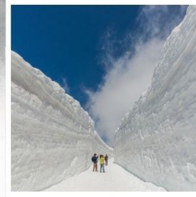
ค้ำแพงหิมะ เจแปนแอลป์