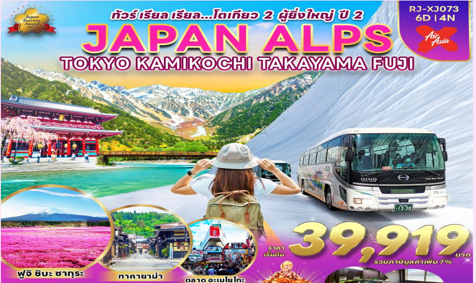
ฟูจิ ชิบะ ซากุระ