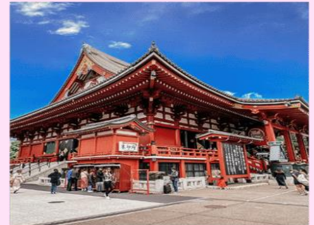
วัดอาซากุสะ SENSOJI TEMPEL | ASAKUSA TOKYO