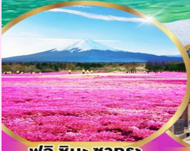
ฟูจิ ซิบะ ซากุระ