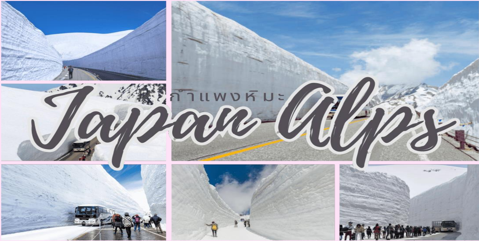
รูปใช้เพื่อประกอบการโฆษณาเท่านั้น

จากนั้นนำท่านชม กำแพงหิมะ (Yuki no Otani) โดยก่อนที่จะมีการเปิดการใช้งานเส้นทางนี้ตามกำหนดการ จะมีการนำเครื่องจักรมาโกหิมะเพื่อเป็นการเคลียร์เส้นทางให้รถบัสวิ่งได้ โดยที่หิมะจำนวนมากจากชั้นตอนนี้ จะถูกนำไปกองไว้ บริเวณสองข้างถนนจนเกิดเป็นกำแพงขนาดใหญ่ จุดสูงสุดของกำแพงที่เคยวัดได้อยู่ที่ประมาณ 20 เมตร นับเป็นจุดที่น่าตื่นตาตื่นใจ และสวยงามอย่างแท้จริง อิสระให้ท่านเก็บภาพความสวยงามของกำแพงหิมะที่สวยงามตามอัธยาศัย ได้เวลาอันสมควรนำท่านขึ้นรถบัสทาเทยาม่าโคเจน (Tateyama Kogen Bus) เพื่อเดินทางสู่บิจูดะ (Bijodaira) (ใช้เวลาประมาณ 50 นาที) รถบัสจะวิ่งผ่านกำแพงหิมะเป็นช่วง ๆ จากนั้นนำท่านสู่สถานีทาเทยาม่า (Tateyama Station) โดยเคเบิลคาร์ทาเทยาม่า (Tateyama Cable Car) อีกครั้ง (ใช้เวลาประมาณ 7 นาที)