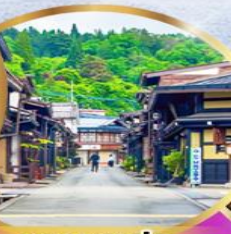
ทาคายาม่า