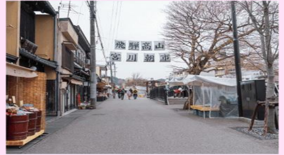
รูปใช้เพื่อประกอบการโฆษณาเท่านั้น