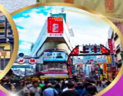
ตลาด อะเมโยโกะ

ราคา เริ่มต้น 39,919 บาท รวมภาษีมูลค่าเพิ่ม 7%