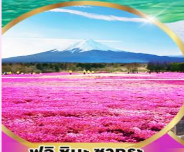
ฟูจิ ซิบะ ซากุระ