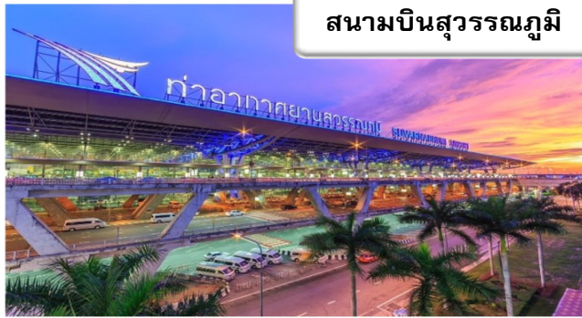
สนามบินสุวรรณภูมิ

เวลา 19.00 น. พร้อมกันที่ สนามบินสุวรรณภูมิ อาคารผู้โดยสารขาออกระหว่างประเทศเคาน์เตอร์ สายการบินไทยแอร์เวย์ เจ้าหน้าที่คอยให้การ ต้อนรับ ดูแลด้านเอกสาร เช็คอิน และสัมภาระใน การเดินทาง