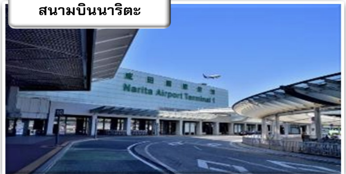
สนามบินนาริตะ