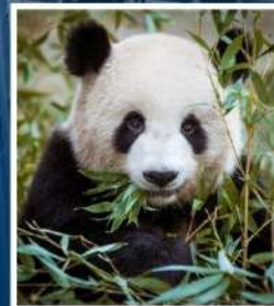
ศูนย์อนุรักษ์หมี แพนด้า