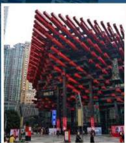
พิพิธภัณฑ์ศิลปะ ฉงชิ่ง