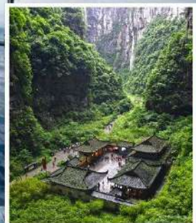
อุทยานหลุมฟ้า สะพานสวรรค์