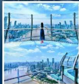
RAFFLES CITY CHONGQING