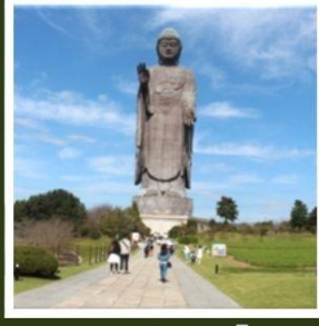
พระพุทธรูปอูชิคุโดบุทสึ