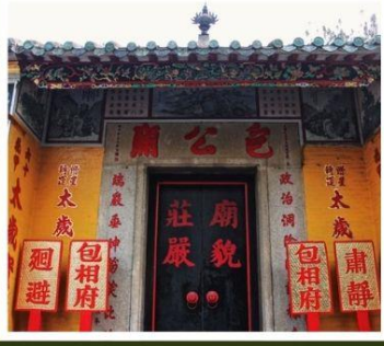
วัดเปากง