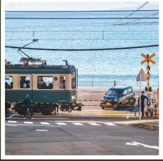
รถไฟเอโนะเด็ตสึ