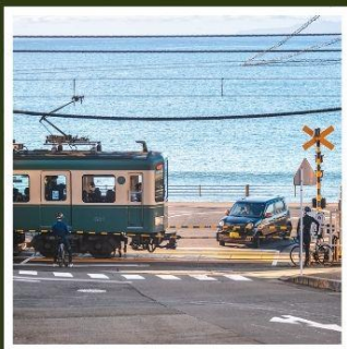
รถไฟเอโนะเด็ง