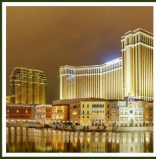
เดอะ เวเนเชียน

ฟูจิยามะ ทาวเวอร์ ขึ้นชมฟูจิจากสวนสนุกที่ไม่เหมือนใคร ชมไร่ชาโอบุจิชะชะบะ อันเลื่องชื่อ สักการะพระพุทธรูปอูชิคุโดบุทสึ องค์พระใหญ่ที่สุดของประเทศญี่ปุ่น เปลี่ยนบรรยากาศนั่งรถไฟริมทะเลสุดคลาสสิก ในเมืองคามาคุระ กราบไหว้ขอพรกับเทพเจ้าองค์ที่สวยเจี๊ย วัดเปากง สัมผัสความอลังการของ เดอะ เวเนเชียน รีสอร์ทระดับเวิลด์คลาส พักผ่อนเซ็น 1 คืน!!! // อาหาร : บุฟเฟ่ต์ซาบูยักซ์, บุฟเฟ่ต์ซาบู กรุ๊ปสบายๆ เพียง 25 ท่านเท่านั้น!!!