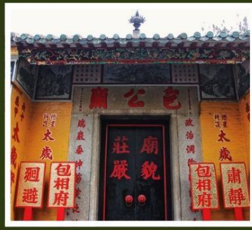
วัดเปากง