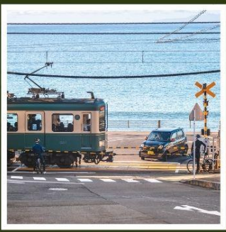
รถไฟเอโนะเด็ตสึ