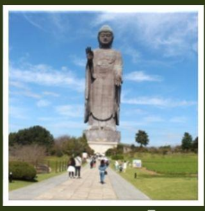
พระพุทธรูปอูชิคุโดบุทสึ