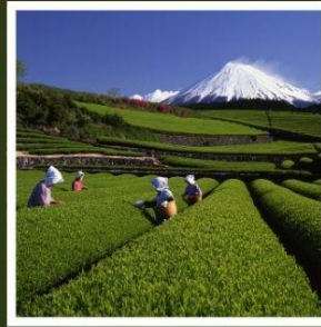
ไรโซออบุจิซะซะบะ