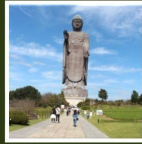
พระพุทธรูปอุซึคุโตบุทสึ