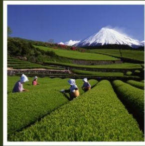
ไร้ซาโอบุจิชะชะบะ