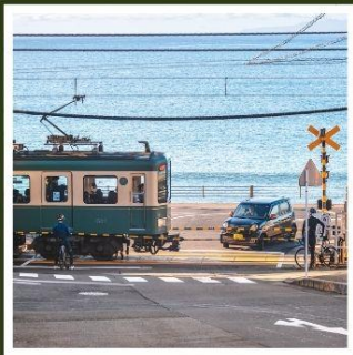
รถไฟเอโนะเด็ง