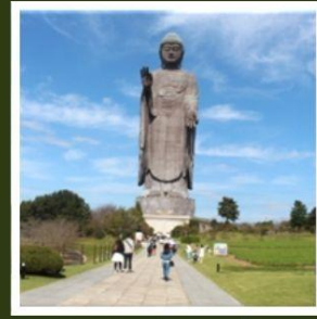
พระพุทธรูปอูชิคุไดบุทสึ