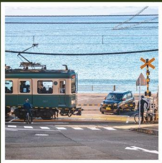
รถไฟเอโนะเด็ง