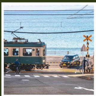
รถไฟเอโนะเด็ง