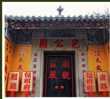
วัดเปากง