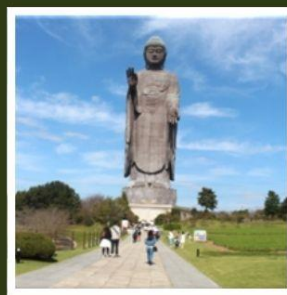
พระพุทธรูปอูชิคุโดบุทสึ