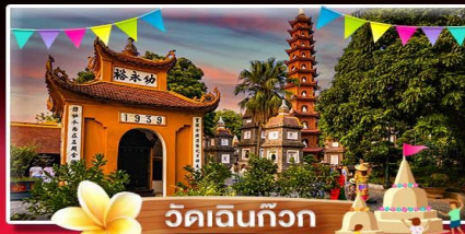
วัดเจดินทิว