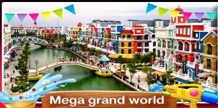
Mega grand world

ที่สุดของธรรมชาติ "เที่ยงดงามเหนือ" ไพล์สวอย บินเช้า-กลับดึก