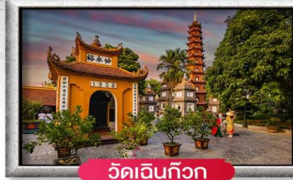
วัดเงินทิว๊ก